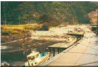
かわを上がって来る津波の様子