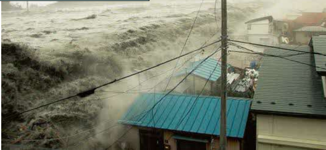
ていぼうを越えて町に来る津波