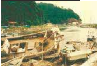
津波の被害を受けた船

1983年5月に秋田県の近くで起きた地震（マグニチュード7.7）による津波で は、隠岐地方・島根半島で家の中に水が入りました。船も壊れました。