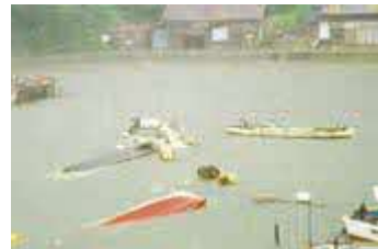
津波の被害を受けた船

1993年7月の北海道の近くで起きた 地震（マグニチュード7.8）による津波で は、隠岐地方・島根半島で家の中に水が 入りました。田んぼや畑、漁船などに 被害がありました。