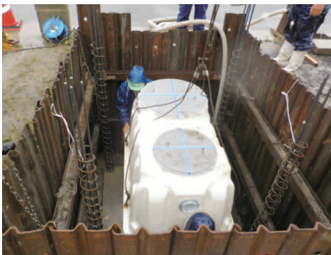
合併浄化槽の設置状況