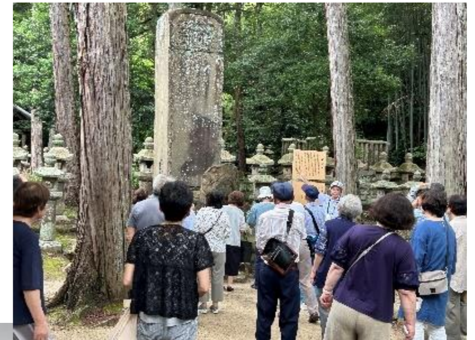
ふるさと再発見の旅→