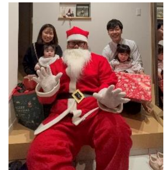
↑サンタがおうちにやってくる