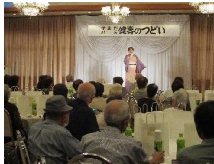
ふえすた・あみーご・いわの→