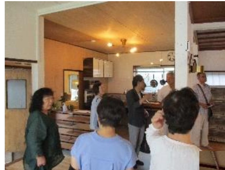
←ひらた空き家再生舎