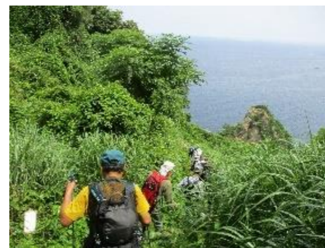
↑自然散策ウォーク