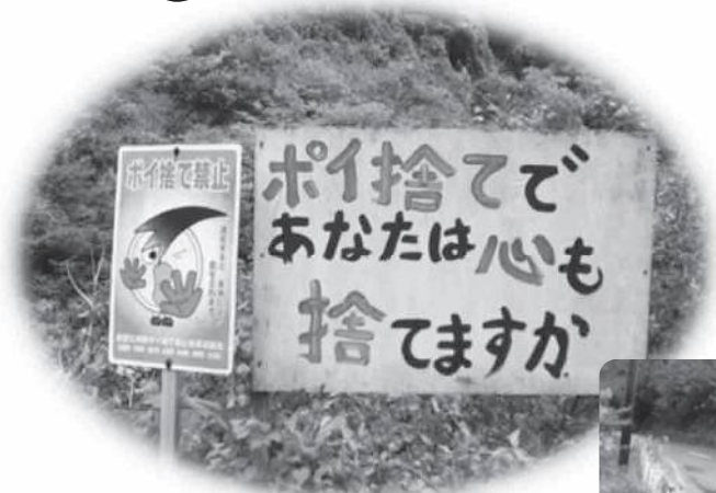
地域の方々による手作り看板(佐田地域)

不法投棄は「廃棄物の処理及び清掃に関する法律」により固く禁止されています。不法投棄は絶対にしないでください。