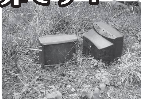
不法投棄されたテレビ等

不法投棄された廃棄物は、美観を損なうばかりか、新たな不法投棄を誘発し、環境汚染を引き起こし、生活環境を悪化させることになります。このようなことは一人ひとりのモラルの問題で、心がけしだいで解決できることです。