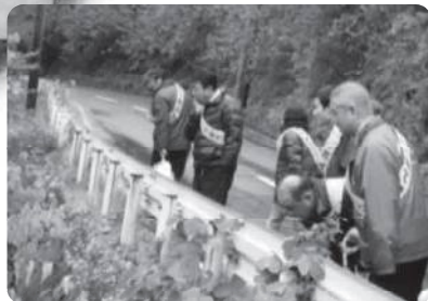
パトロールの様子(佐田町大呂地内)