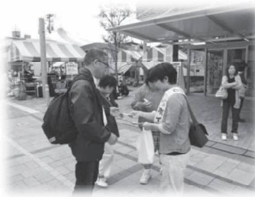
キャンペーンの様子(夢フェスタin出雲会場)