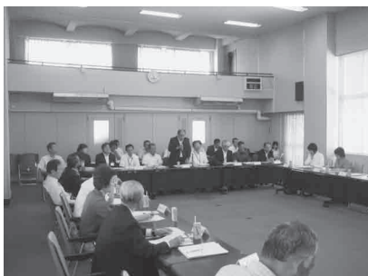
3分科会による地域まちづくり計画の検証