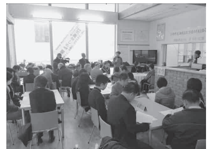
「小中学生と地域住民と多伎の未来を語りあう会」