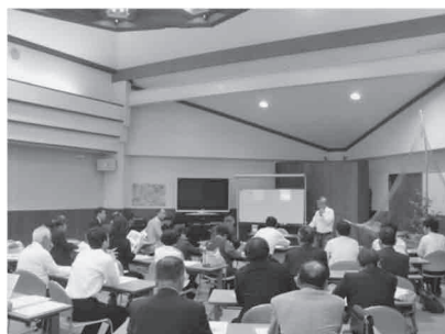
まちづくり研修会 ～地域運営の仕組みづくりによる事業・施策の検討～