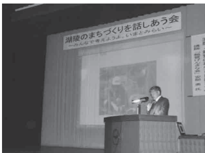
「湖陵のまちづくりを話しあう会」