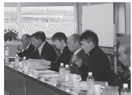
まちづくり計画策定作業