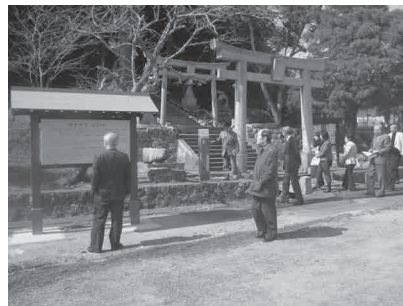
「出雲神話を学ぶ」 【出雲地域協議会】

住民が主体的に地域課題を解決し活力あるまちづくりを進めるため、自主的な活動を行っています。