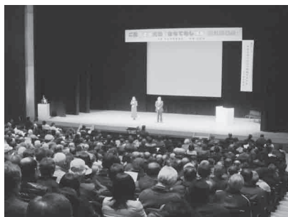
ご縁のまち大社「おもてなし活動」総決起集会