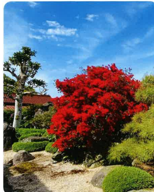
キリシマツツジ。鮮やかな深紅の花が見事に咲き誇っています。(船津町)

春になり、上津地区のあちこちで花々が咲き誇っています。今回はごく一部ではありますが、ご紹介します。