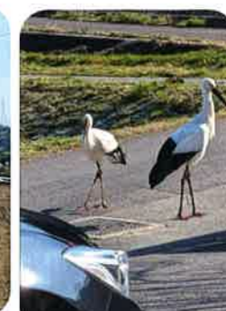
コウノトリ(船津上ヶ)