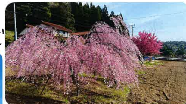
枝垂れ桜。満開の枝ぶりに道行く人が車を止め、眺めていくこともあるそうです。(延畑)