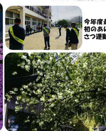
御衣黄桜(上郷神社)