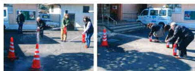
2月17日(火)、コミセンを使用していた民生委員児童委員協議会の皆様と一緒に訓練をしました。