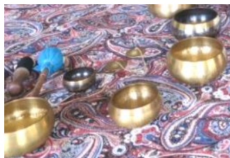
シンギングボウル

★申し込み: 2月2日 (金) までに日御碕コミュニティセンターへ申し込みください。