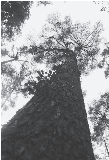
▲市内には立派な松がたくさんあります。

詳細につきましては、森林政策課、森林組合または造園業者等にお問い合わせください。