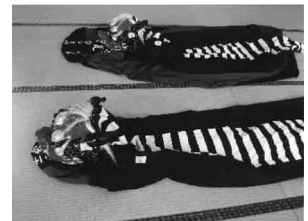
五和会で整備した祭り衣装の一部