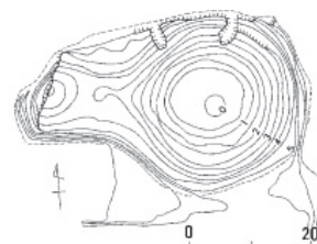
神庭岩船山古墳墳丘測量図