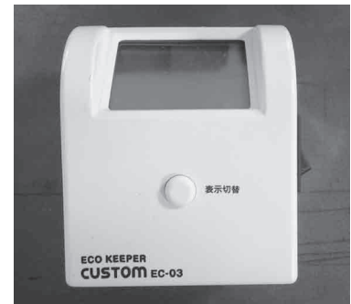
電力測定器 「エコキーパー」

使った電力量や電気料金などが確認でき、想像以上に電力を使っていたり、また逆に使っていないかたり意外な結果が確認できます。