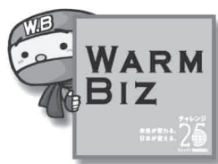
あったか忍者 【あったか丸】