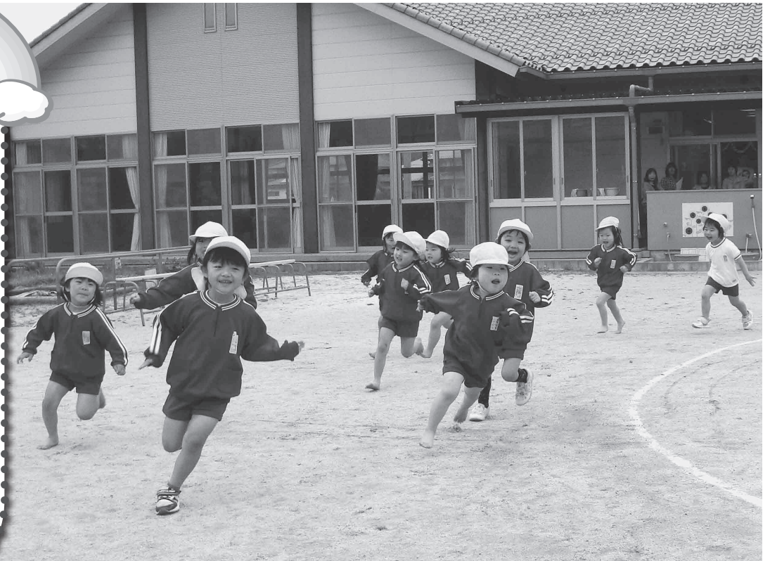
湖陵幼稚園 「おはようランニング」よ～いどん！風を切って気持ちよかったよ

幼稚園は、家庭や地域と連携しながら、幼児が集団生活を通して、心身の健やかな発達的基础となる力を培っていくとともに、小学校入学以後に必要な生活や学習の基盤を育てていく教育の場です。各幼稚園では、それぞれの地域の特性を活かしながら、特色ある活動を行っています。