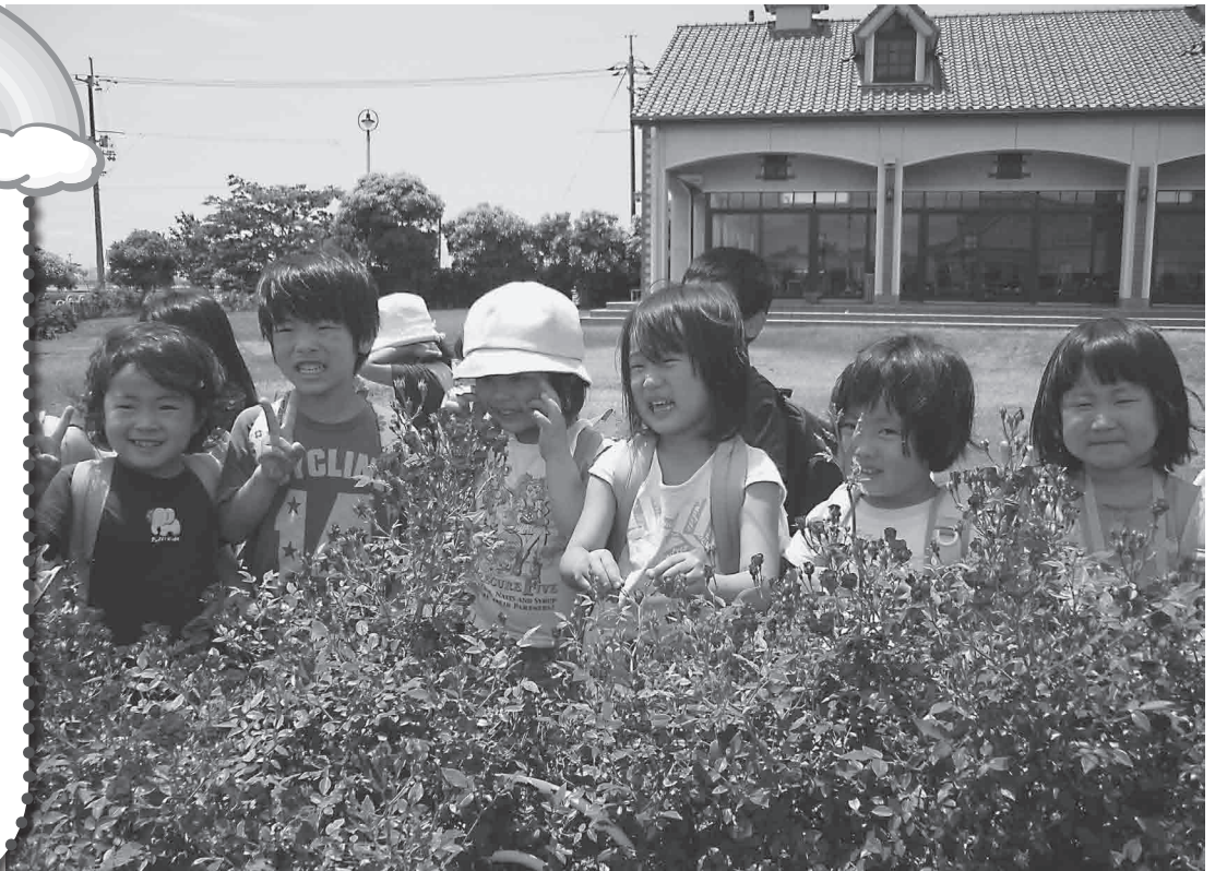
“きれいだな きれいだね” 園外保育の様子（こぐま保育園）

保育所は、保護者の就労などさまざまな事情により、家庭で保育することができない子どもを預かる児童福祉施設です。