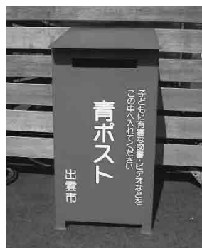
出雲市 青ポスト 出雲市体育館など4か所に設置している青ポスト

子どもや若者を取り巻く環境を守るため、有害図書類を回収する「青ポスト」を設置します。