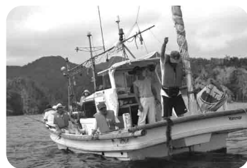
田舎暮らし体験(鷺鷥地区)▶