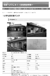
いずも空き家バンク▶

市内に空き家・空き地をお持ちの方で、売却・賃貸をお考えの方は情報提供をお願いします。