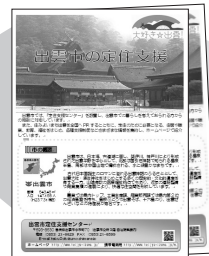
定住パンフレット もあります