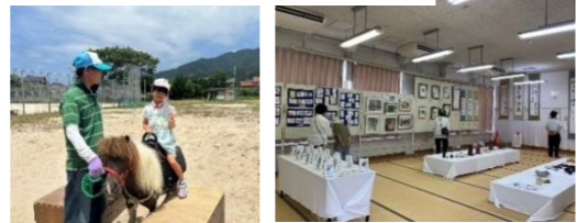
令和7年度「古代ハスマつり」の様子

今年度も各種イベントや大抽選会、作品展示コーナー、フリーマーケット、おいしい・楽しい屋台が来店！地域の夏祭りをみんなで楽しみましょう♪ くわしい内容は、全世帯配布した 抽選券付きチラシ をご覧ください。 皆さまのご来場お待ちしております。