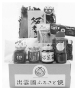
出雲の味 詰めあわせ