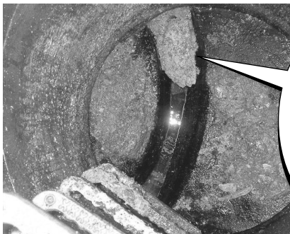
配管内で冷えて固まった油

宅内の排水管・ますの維持管理は、所有者の方のお願いです。排水管の清掃業者が訪問し、清掃を勧誘するケースがありますが、市から排水管の清掃を依頼することはありません。もし、宅内の排水設備の詰まりや流れが悪いなどの問題があれば、市の指定工事店へ依頼してください。