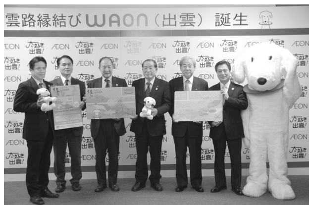
▲出雲路縁結び WAON(出雲)カード発売へ

なお、このカードの利用金額の0.1%は、出雲市の「日本の心のふるさと出雲応援基金」ならびに「出雲市トキとの共生まちづくり基金」へ寄附されることとなります。