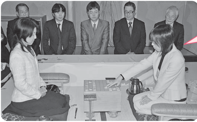
初手を指す里見女流名人(右)。対局者は清水女流六段