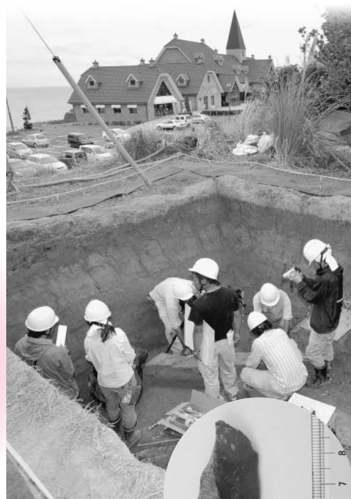
砂原遺跡発掘現場