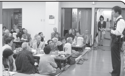
モデル地区指定式が10月3日に行われました。写真は、指定式の中で行われた、警察による振り込め詐欺のワンポイントアドバイスの様子。

9月から、日御碕地区がモデル地区に指定されました。出雲市と出雲警察署が協力し、被害発生時には速報を流したり、地区単位で勉強会を実施するなど、被害防止に取り組めます。