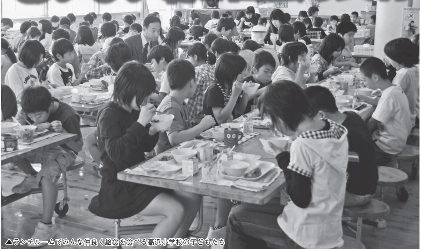
△ランチルームでみんな仲良く給食を食べる高浜小学校の子どもたち