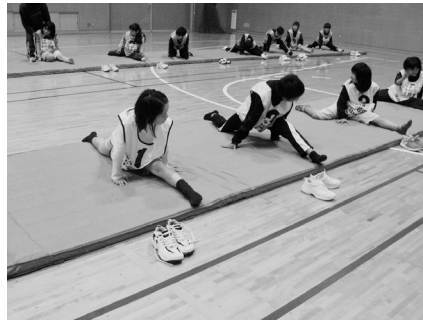
キッズ・パートの体操の様子

もの希望や適正に応じた競技種目を検討していこうとするものです。昨年度は、体力テストや面接の選考を実施して受講者を決定。6か月間にわたって、陸上・体操・アイススケートなどの知識・技術の習得や、運動神経をよくするトレーニングを行いました。体力テストで、ほとんどの受講生の得点が上がると、効果が現れています。