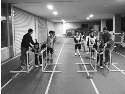
キッズ・パートの陸上の様子

おたすね 出雲スポーツアカデミー事務局（文化スポーツ課内） TEL：21-6786 FAX：21-6517