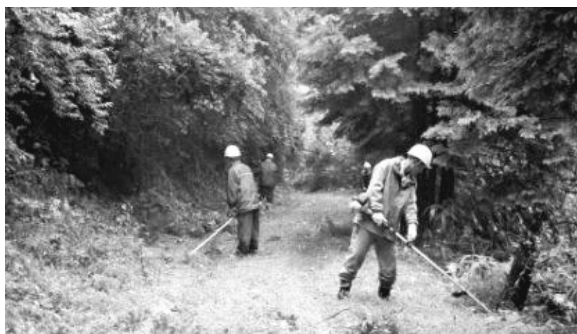
集落応援隊の機材購入費用の一部にも、ふるさと寄附を活用しています。（写真は7月4日に実施した市内窪田地区における草刈作業）

ご寄附いただくと、所得税と住民税から寄附額が一定の限度まで控除されるほか、出雲市独自の取り組みとして、特典を用意しております。