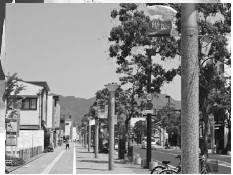
▶ 「椿姫」のフラッグで歩道が彩られました

オーケストラがあり、合唱が盛んな出雲市で、平成15年から毎年開催している「出雲の春音楽祭」。