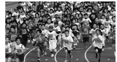
子どもたちも自慢の健脚を競います。(写真は昨年の様子)