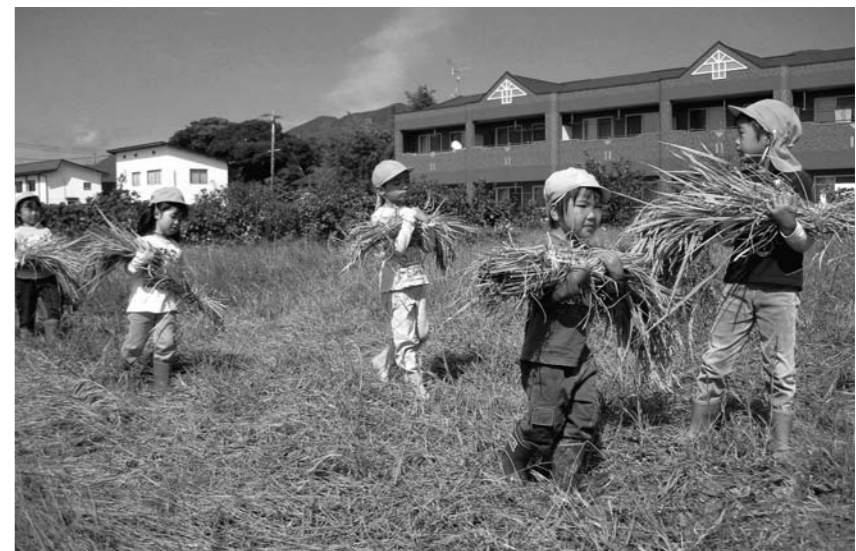
長ぐつをはいて、稲刈りを体験したよ(川跡幼稚園)

▼申込方法 ◆受付期間 / 12月3日(木)～12月10日(木) ◆提出書類 / 各幼稚園にある『入園願』に記入し、入園を希望する幼稚園へ提出してください。用紙は市のホームページからも取得できます。 ◆入園申込が定員を超えた場合、抽選により決定します。