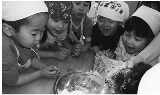
みんなで楽しくお団子づくり(あすなろ第2保育園)