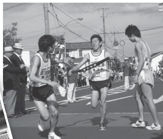
沿道での声援は、選手に力を与えます