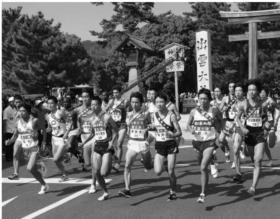
出雲大社正面鳥居前(勢溜)をスタート(前回大会)