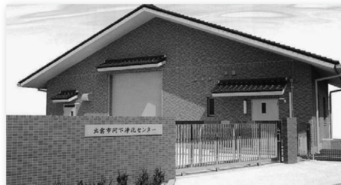
平成21年3月には「河下地区特定環境保全公共下水道施設」が完成

市では、出雲市汚水処理整備計画に基づき、公共下水道などによる集合処理区域と、合併処理浄化槽による個別処理区域を設定し、快適な生活環境をつくるため、効果的に下水道の整備を進めています。平成21年3月末現在、市内に住んでいる人の69.3%が、下水道や浄化槽などを利用できるようになりました。