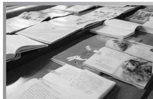
△切り取りや落書きされた本がたくさんあります(出雲中央図書館の展示の様子)