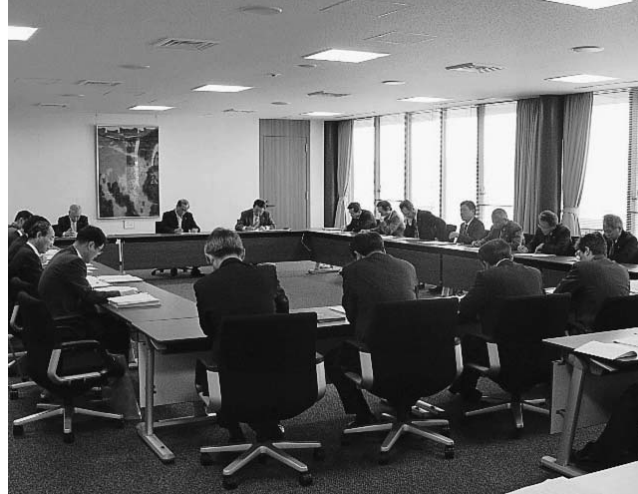
5月19日、出雲市新型インフルエンザ対策推進本部緊急本部会議