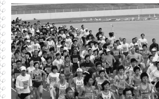
日ごろ鍛えた健脚を競う選手たち