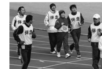
ボランティア「愛走フレンズ」の伴走でゴールを目指す視覚障がい者ランナー

大会運営や交通規制に対し、多くの皆さまのご理解とご協力をいただきありがとうございました。