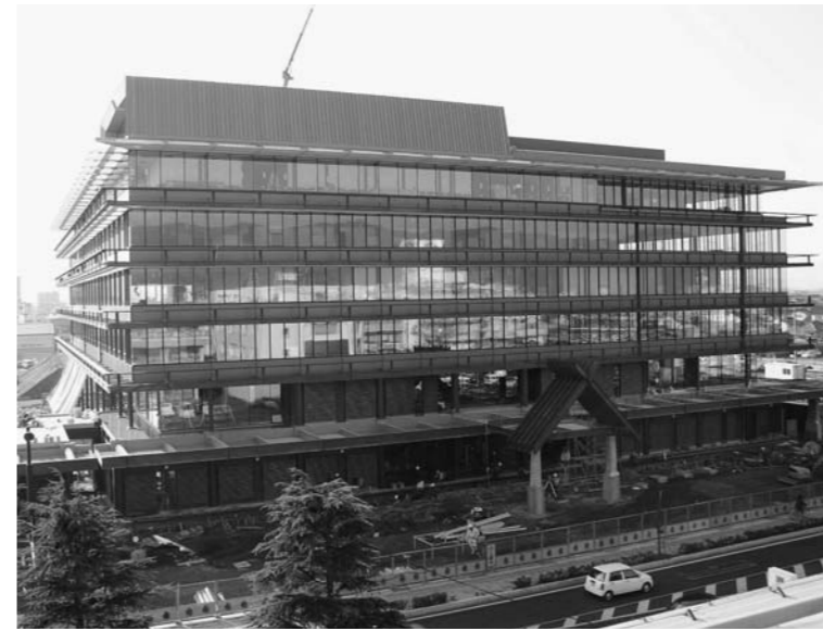
現庁舎屋上から見た写真(12月29日現在)

完成間近となった市役所新庁舎。今回は、新庁舎の配置などについてお知らせします。 新庁舎での業務は、移転完了した部署から逐次行います。詳しい移転スケジュールは、次号の広報いすも第93号(1月29日発行)でお知らせします。 移転期間中は、ご迷惑をおかけしますが、ご協力をお願いいたします。