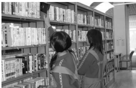
返却された本を書架へ一冊ずつ戻す仕事をしました(海辺の多伎図書館)