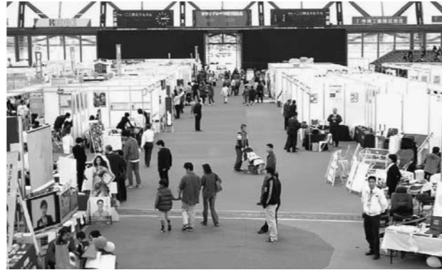
暮らしに役立つ魅力的な製品・技術が盛りだくさん(出雲ドーム)

地元企業の元気とアイデアに触れれば、きっと新しい発見があるはず! 楽しいイベントや体験コーナーも盛りだくさん。この機会にぜひ、各企業等一押しの商品・技術に触れてみてください。