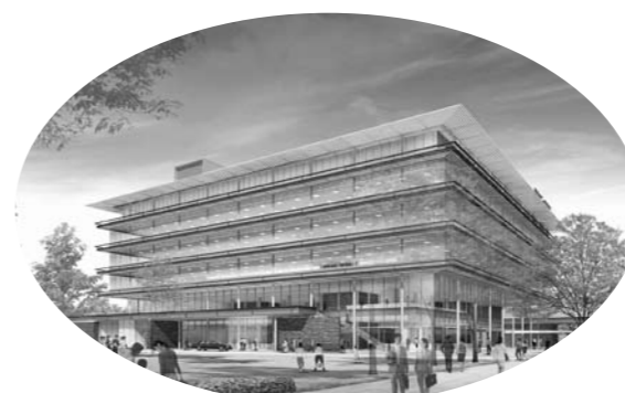
新庁舎完成イメージ図(公園側より)

※移転期間中は現庁舎と新庁舎両方で業務を行うこととなります。市民の皆さんにご不便をおかけしますが、ご理解・ご協力をお願いいたします。