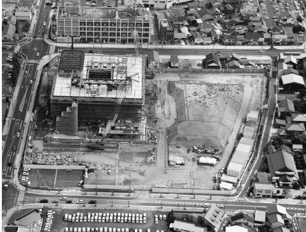
建設中の市役所新庁舎(航空写真・西側より撮影)

新庁舎と一体となった広場として、イベントなどの多目的な市民交流の場、また、各ゾーンごとのテーマにふさわしい樹木を植栽し、うるおいのある、緑豊かな緑地空間となる計画です。