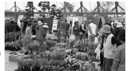
色とりどりのきれいな花が楽しめます(昨年の様子)

花の苗・種などを 先着200人にプレゼント 配付時刻:4/19日は9時15分～ 4/20日は9時30分～