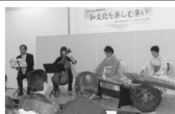
市民活動支援事業「和文化を楽しむ集い」

市では、市民団体・女性団体の皆さんが、地域の課題を解決するために自主的に創意工夫して取り組む活動を支援します。皆さんのさまざまなアイデアや斬新な発想で、市民協働のまちづくりを進めてみませんか。