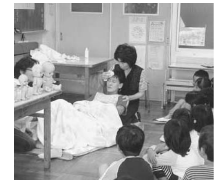
バースデブプロジェクトの出産劇に子どもたちもハラハラドキドキ