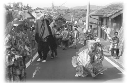
それぞれの地域で特色のある活動を行っています(写真は板津地区秋祭りでの子どもみこし)