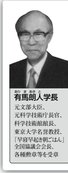
有馬朗人学長 元文部大臣、元科学技術庁長官、科学技術館館長、東京大学名誉教授、「早寝早起き朝ごはん」全国協議会会長、各種勲章等を受章