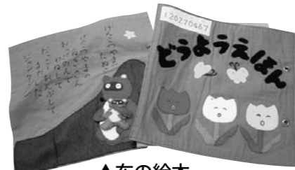
▲布の絵本 ボランティアの手作りです