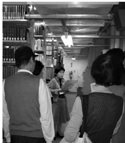
▲閉架書庫には、現在では入手困難な本も保管しています(図書館探検ツアーの様子 出雲中央図書館)

図書館の利用者は年齢も職種も多様で、求められる資料の種類も異なります。なるべく多くの要望に応えられるよう、資料の選定には慎重さが求められます。出雲市は6館の図書館を有し、県内でも恵まれた環境にあります。図書館ネットワークの整備と共に、図書館資料の収集・整理・保存・公開について6館の意思統一を図り、その協力体制のもとで資料の活用を目指します。