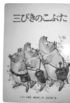
▲大型絵本 (右は通常サイズ)