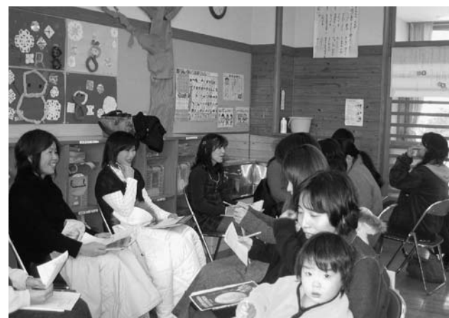
各地域で男女共同参画推進にむけた自主的な活動が行われる一方、高齢者クラブや自治会、PTAなどで市の「出前講座」などを利用した積極的な動きも芽生えつつあります (写真は上津幼稚園で開催されたPTA講習会 1月22日)

家庭・地域・教育現場・職場での小さな取り組みが男女共同参画社会を形成していきます。一人一人が、身近なところから男女共同参画のまちづくりについて考えてみましょう。