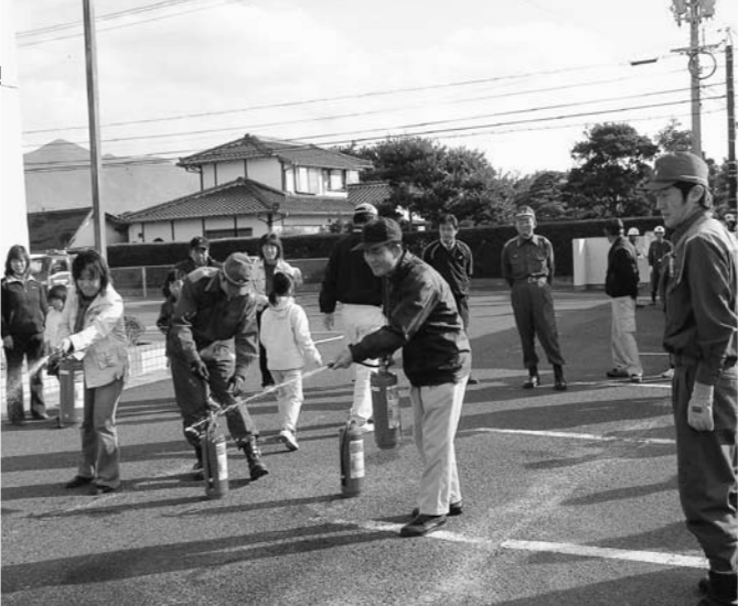
水害・火災・地震...誰に助けを求めますか? (写真は「大社地域」斉防災避難訓練)