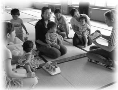
子育ての不安を解消(写真は多伎町の幼児を持つ家族の学習会「たんぽぽ」)