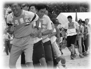
楽しいイベントもたくさんあります(写真は塩冶地区体育大会)