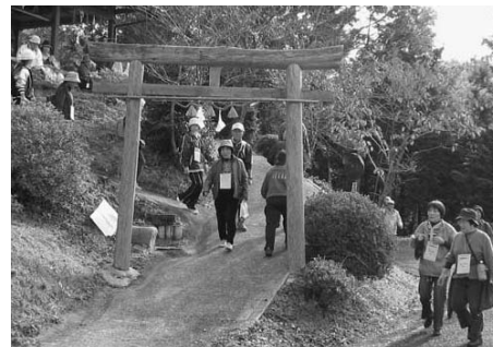
スタッフの温かい声かけに励まされ、最後まで歩くことができました(11月23日 佐田町須佐)

11月23日、秋晴れの中、須佐の七不思議と冷風が吹き出す八雲風穴や島根名水百選でも知られる福寿泉など佐田町の名所を巡る第6回スサノオオークが開催されました。