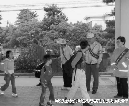
子どもたちの健やかな成長を地域で見守ります