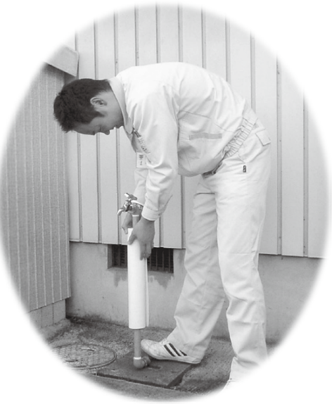
▲寒さに弱い水道管。寒波が来る前に防寒対策をしておきましょう

今年も寒い冬がやってきました。この季節に気を付けたいのは水道管の凍結です。気温がマイナス4度以下になると、水道管が凍結したり、破裂したりすることがあります。寒波に備えて、水道管の防寒対策を忘れずに行いましょう。