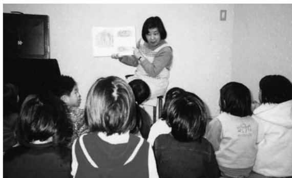
絵本の世界に子どもたちは夢中です(大社図書館)

物語のいい場面で「続きは明日にすると、不満のその後、「次はどうなるのかな」と話が始まります。自分たちでお話の続きを想像して話し合い、翌日のお話の時間を楽しみにしてくれます。