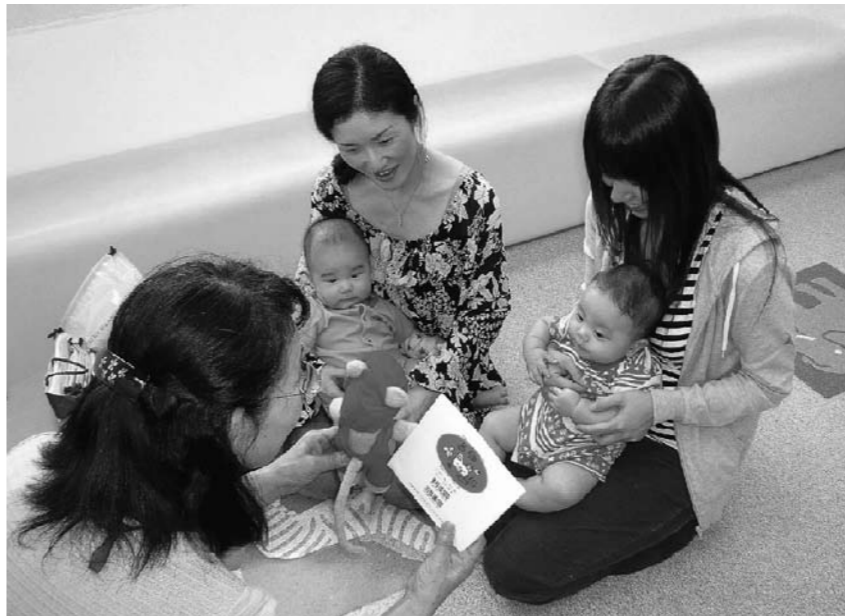
ひざに抱っこされて赤ちゃんもごきげんです(大社健康福祉センター)

さまざまなメディアの普及により、読書離れが指摘されていますが、豊かな強い心を持つ子どもを育てるためには読書は欠かせないものです。年齢に応じた読書活動の取り組みを紹介します。