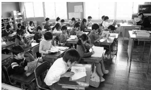
先生と一緒に朝の読書。教室にはページをめくる音だけが響きます(今市小学校)

子どもたちの会話も、「この本が面白かった」「今何を読んでいるの」など、本の話が増えるようです。