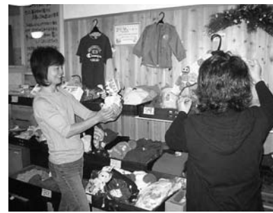
さんあーる出雲「フリマコーナー」

平成19年(2007)11月8日 編集発行：出雲市役所環境保全課 (TEL21-6535 FAX21-6597)