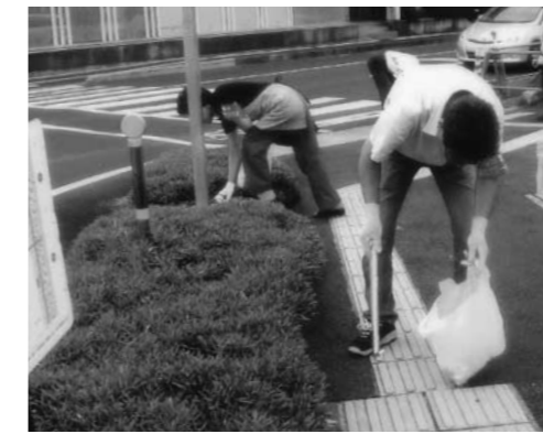
毎月1日の朝に市役所前で活動を行う美化サポートクラブ「かめかめ倶楽部」の皆さん

民の方が増えています。市では、地域で、道路や公園、海岸などの清掃を定期的に行う団体を「美化サポートクラブ」に認定し、清掃に必要な用具を提供するなどの支援をしています。また、市が任命した美化推進員159人が、自ら環境美化活動に取り組みほか、ポイ捨てなどの監視や地区行事などでポイ捨て禁止を呼びかける活動を行っています。こうした努力を踏みにじるポイ捨て行為は、決して許されるものではありません。みんなが捨てないモラルをもつことが大切です。