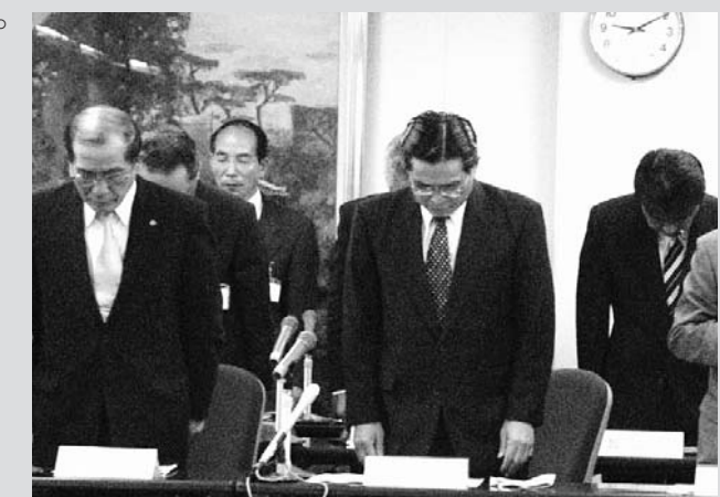
黙とうを捧げる西尾市長（8月28日 出雲市議会全員協議会）

このたびのような事故が二度と起きないように、9月議会に上程した「出雲市安全で安心なまちづくり条例」に公共施設の安全確保を明記し、その体制を強化します。市民の皆さまに公共施設を安心して利用していただけるよう、より一層努力してまいります。