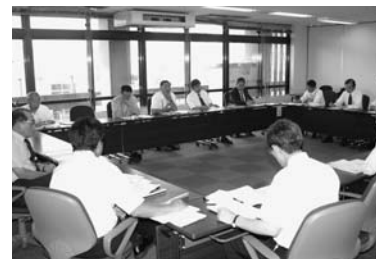
第2回事故調査委員会（8月31日）

委員会では、出雲ゆうプラザでの事故の状況や管理運営体制などを検証し、監視体制など安全管理の一層の強化を検討していきます。施設は体制が十分に整ってから再開する予定です。