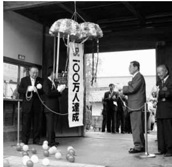
平成15年から入館料が無料となり、利用しやすくなりました

出雲文化伝承館では7月12日、入館者が100万人を突破。平成3年の開館以来、16年目で大台に乗りました。7月22日には入館者100万人達成を記念し、これまで伝承館を支えてきた地元の人たちが市長がくす玉を割って祝いました。また、来館者全員に伝承館の絵はがきが贈られたほか、特別展が観覧無料となるサービスもありました。