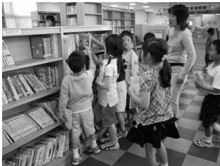
読みたい本を自由に選ぶ子どもたち（湖陵図書館）

読書活動は、乳幼児から高齢者まで、世代に応じて生きる力を与え、生活に楽しみと潤いをもたらしてくれれます。図書館を上手に利用していただくため、今回は、平成18年度の市立図書館利用状況についてお知らせします。