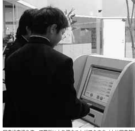
図書検索機を使って簡単に本を探することができます（大社図書館）

館内にある図書検索機を使って、自分で本を探することができます。本の所蔵の有無や本のある書棚の位置、現在の貸出状況などがわかります。